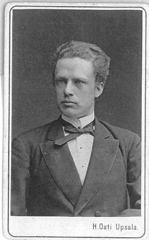
H. Osti Upsala.