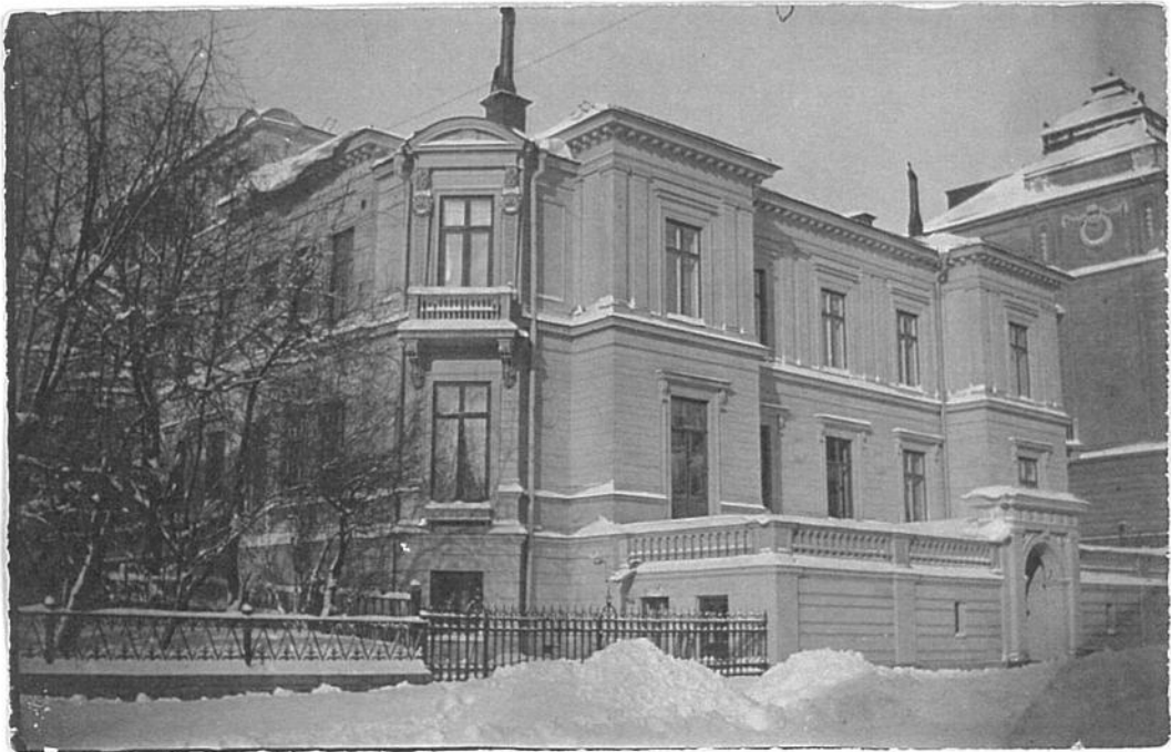
Villagatan 3, Stockholm