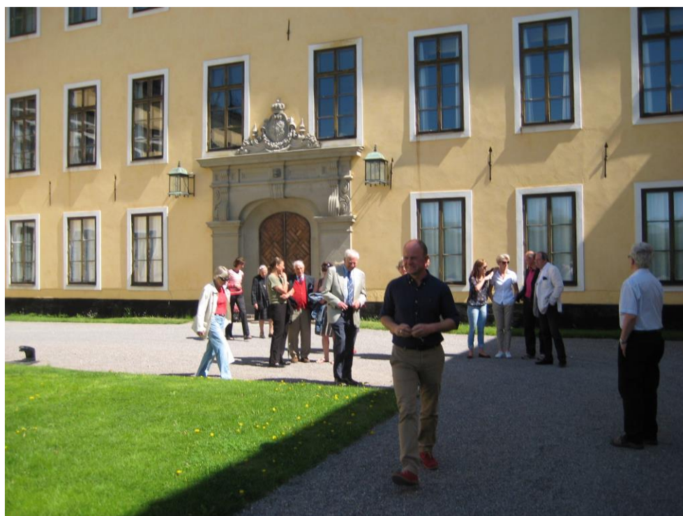
Samling utanför Ulriksdals Slott