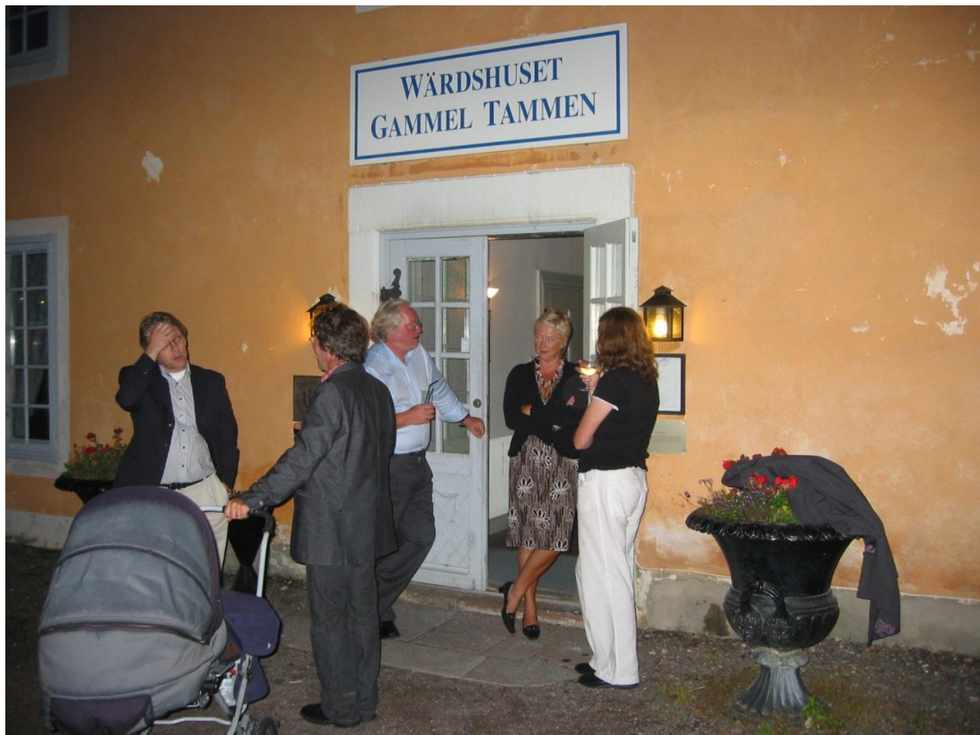
Nattmingel utanför Vårdshuset