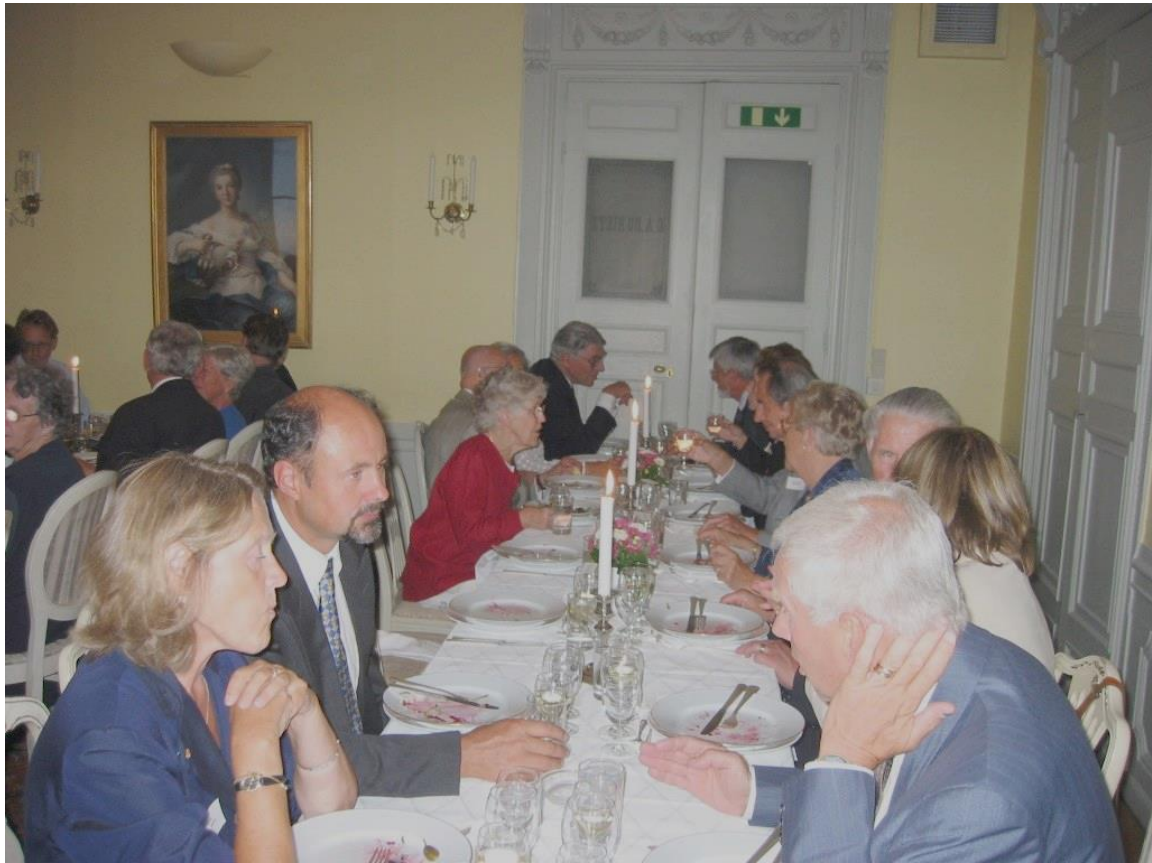
Middag på Sjöfartshuset Skeppsbron 2003