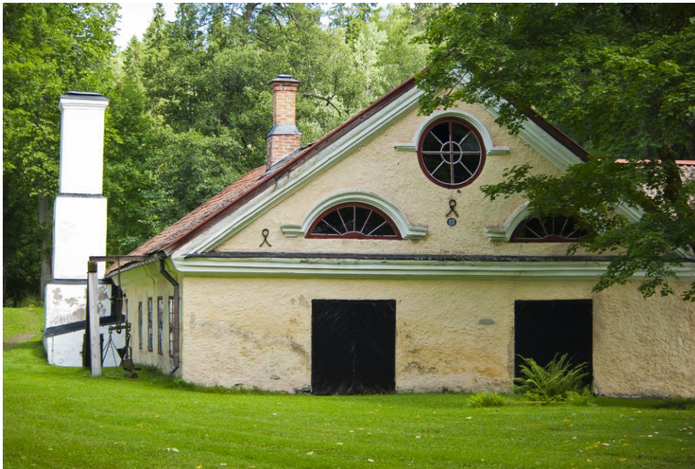
Smedja vid Engelsbergs Bruk