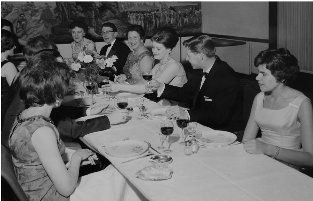
Glatt samspråk mellan finländska och svenska släktingar vid middagsbordet