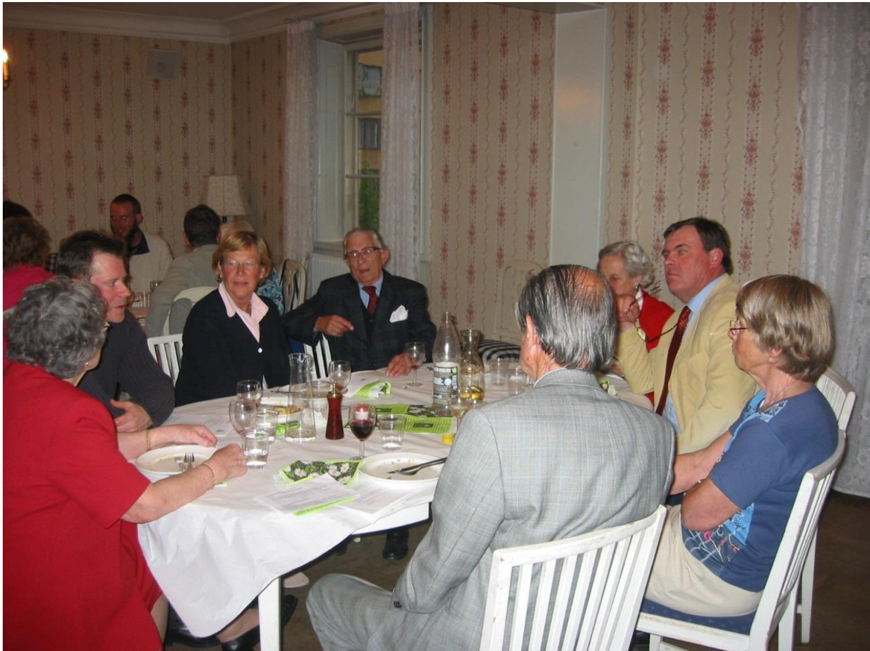
I matsalen på Kristinehovs Malmgård