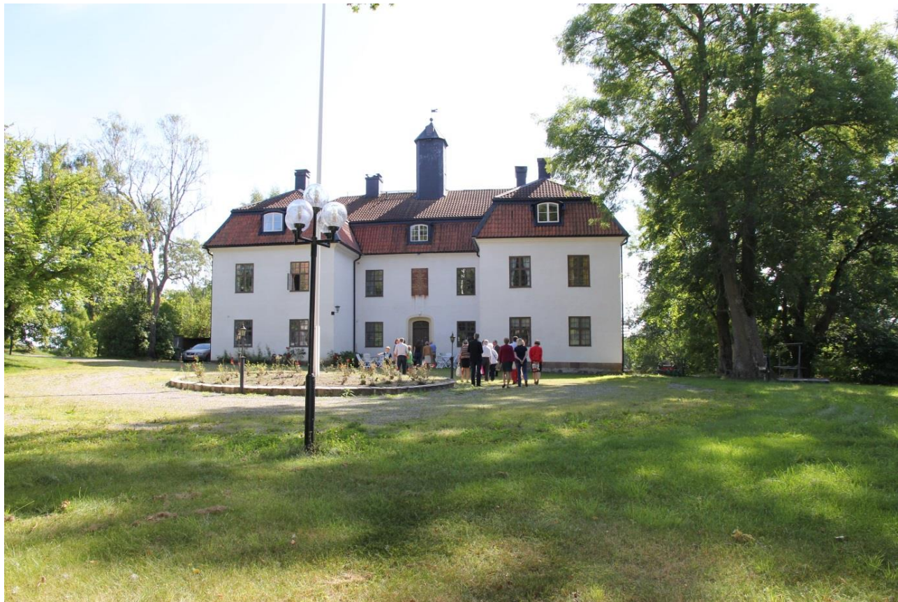
Ludvigsbergs Herrgård, Muskö

1976: Ordinarie släktmöte den 27 maj på Ludvigsberg. Dagen inleddes med högmässa i Muskö kyrka. En av punkterna på årsmötets föredragningslista var ändring i stadgarna i syfte att möjliggöra aktivt medlemskap även för icke agnatiska ättlingar. Förslaget tillstyrktes av mötet men måste godkännas av ytterligare ett släktmöte.