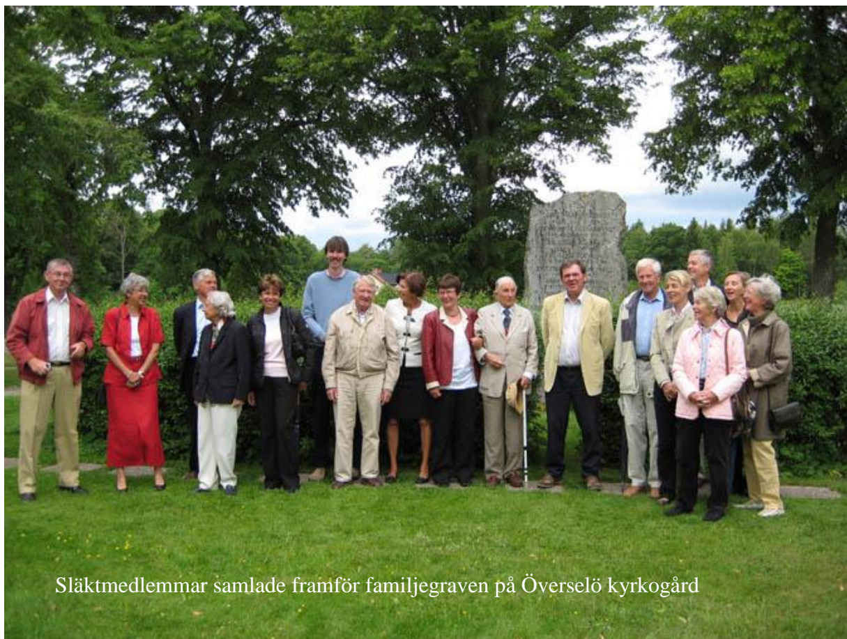
Släktmedlemmar samlade framför familjegraven på Överselö kyrkogård