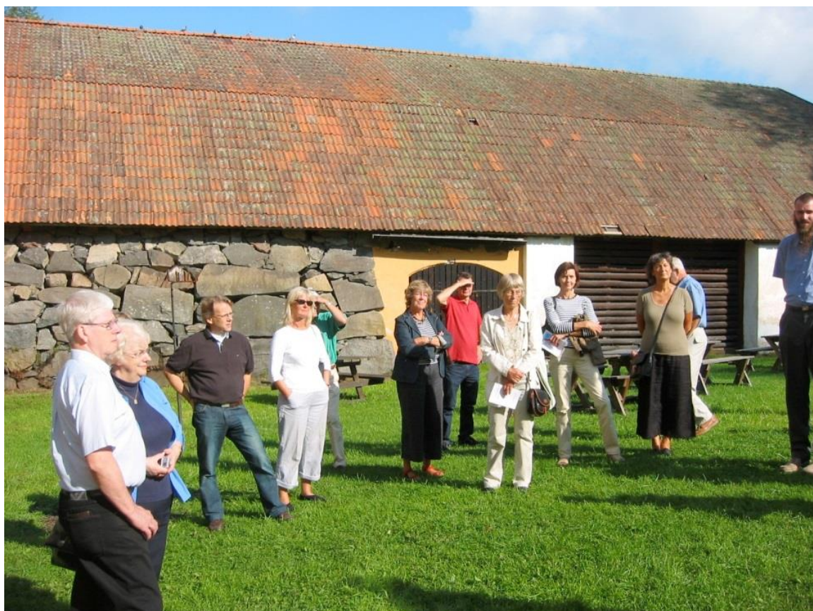
Släktmedlemmar utanför Smedjan