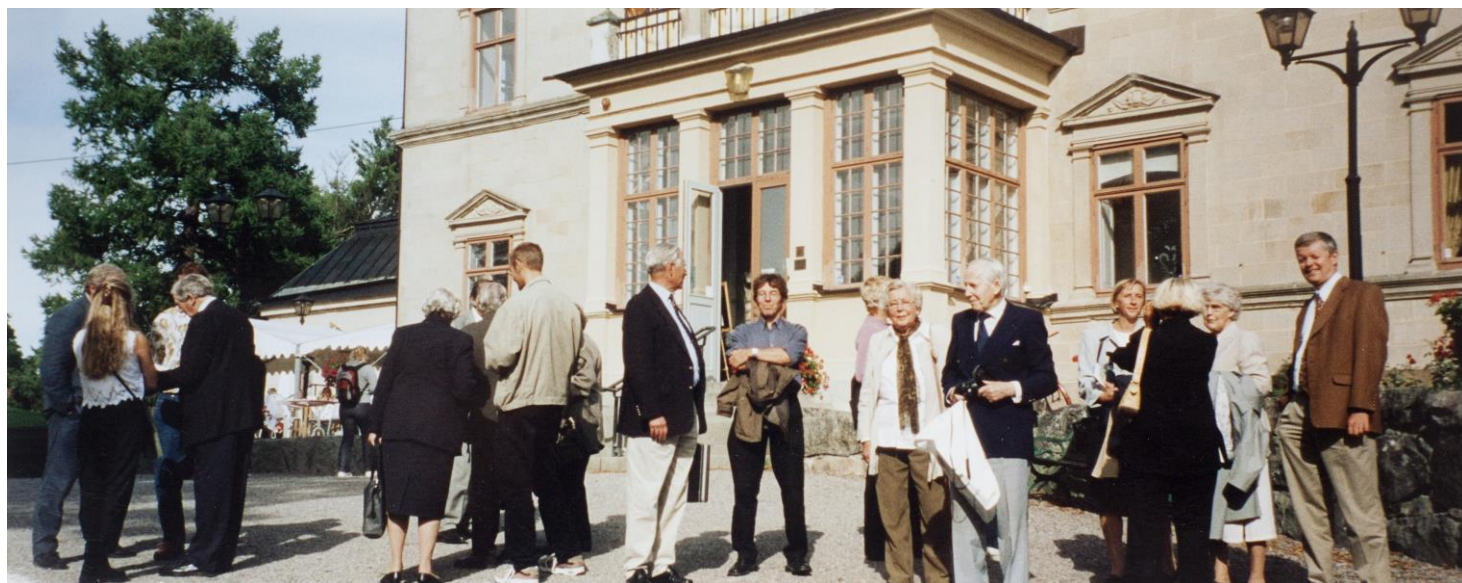
Medlemmar vid Görvälns Slott

1988: Ordinarie släktmöte den 21 augusti på Görvälns Slott, Järfälla, med 29 medlemmar närvarande. Besök på flera olika egendomar runt Stockholm vilka en gång ägdes av BMB, däribland Barkarby, Kallhäll och Viksjö.