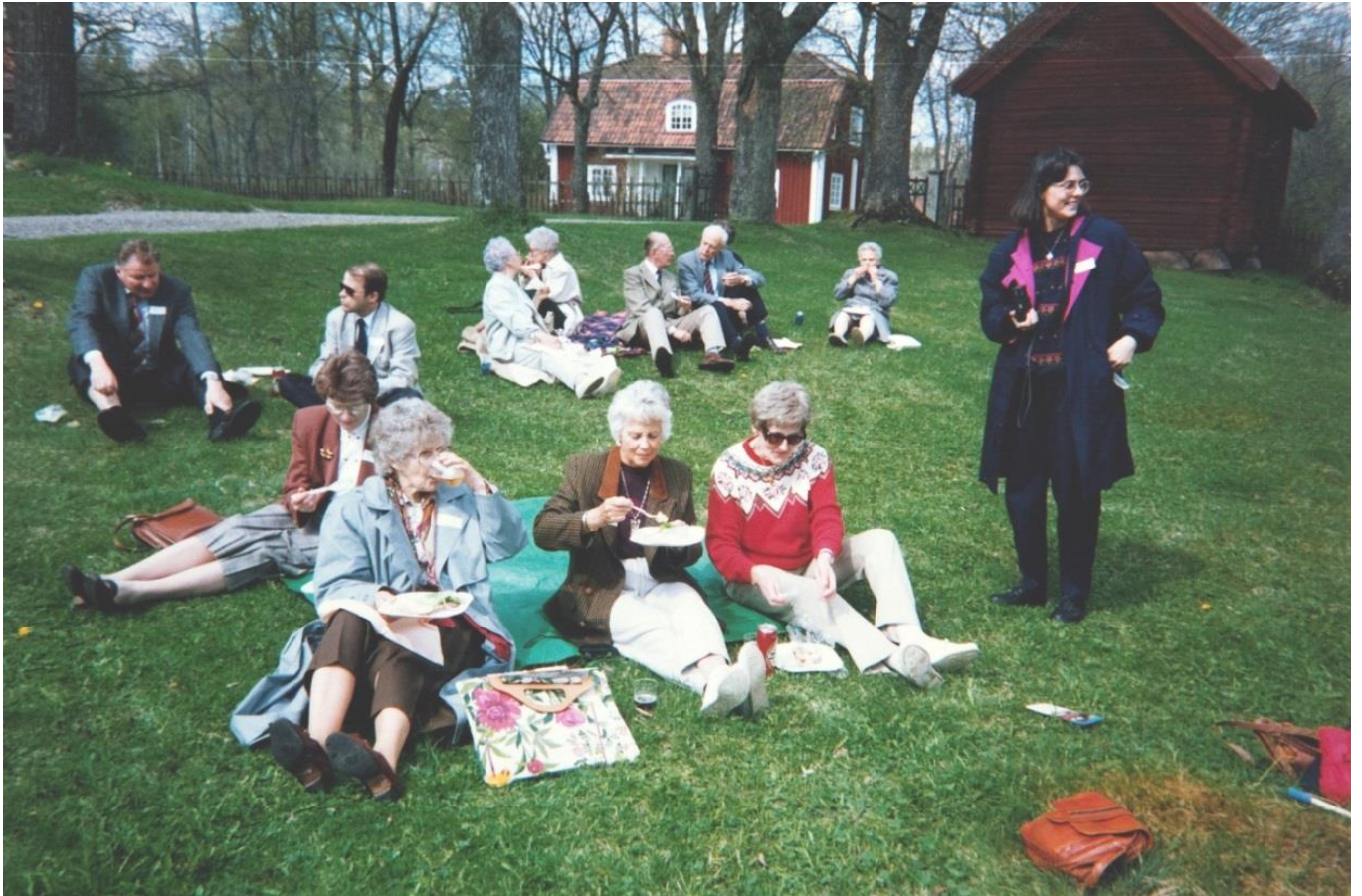
Picknick vid Engelsberg