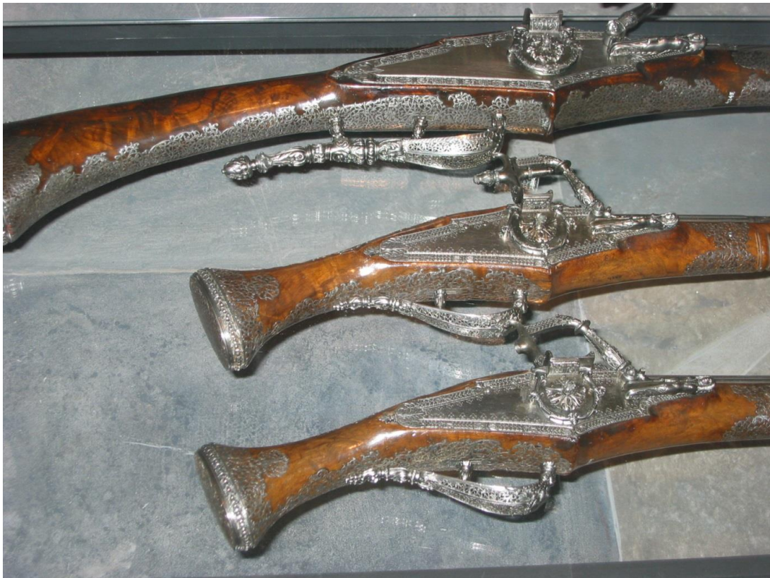
Exempel från vapensamlingen