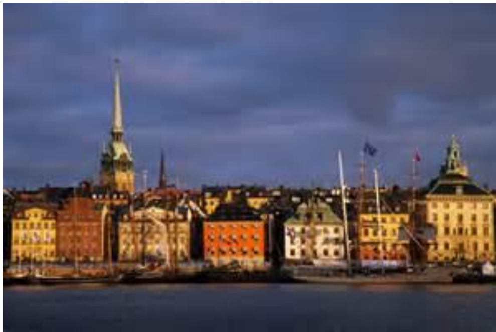
Vy mot Skeppsbron

2003: Ordinarie släktmöte den 30 augusti på Sjöhistoriska museet i Stockholm. Det gemensamma programmet för de båda släktföreningarna under dagen bestod av besök på Sjöhistoriska museet där man tittade på modeller med släktanknytning bl a Stadsvarvet i Tegelviken i Stockholm samt Snauskeppet Gustaf Adolph, byggt vid Värnanäs varv utanför Kalmar. Från Sjöhistoriska museet gick sedan båtut genom Djurgårdsbrunns kanalen till Sjöfartshuset på Skeppsbron där en tre-rättersmiddag serverades.